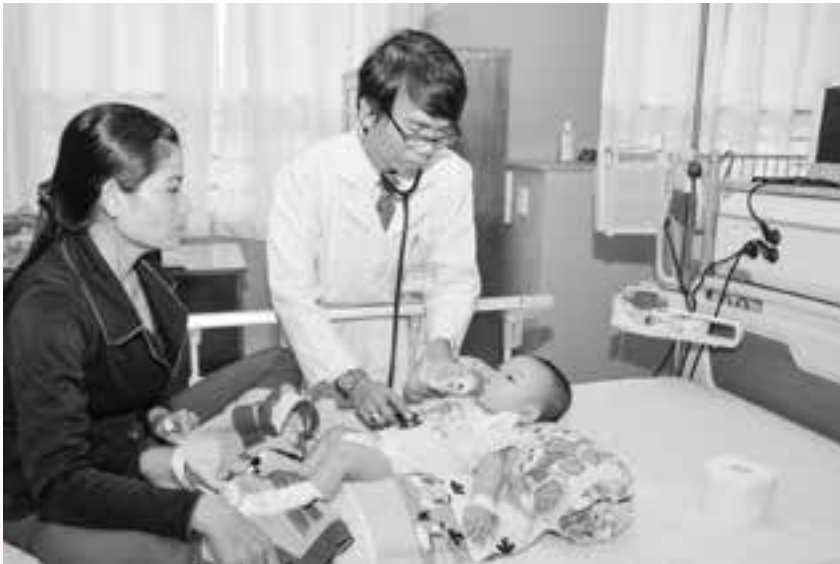
Bác sĩ ân cần thăm khám bệnh nhi (BV. Bà Rịa).