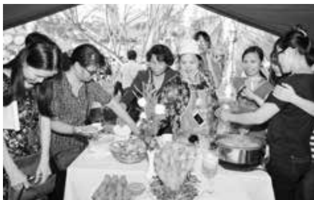
Thi nấu ăn.