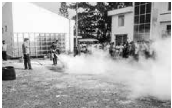
Các học viên thực tập sử dụng bình chữa cháy tại buổi tập huấn.

Buổi tập huấn đã giúp cho CBCNV trong đơn vị nhận thức sâu sắc và có ý thức trách nhiệm trong việc