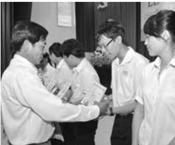
Học bổng khuyến học, khuyến tài với sự vận động tích cực của Ban Nữ công các công đoàn cơ sở được duy trì đều đặn hàng năm.