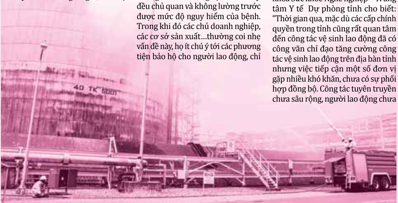
Diễn tập phòng chống cháy nổ tại kho xăng dầu.