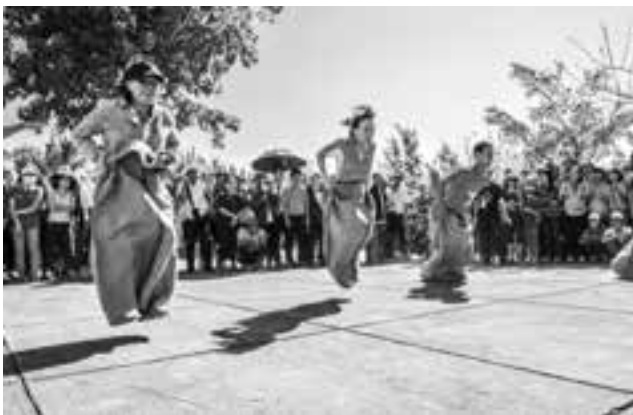
Thi nhảy bao bố.