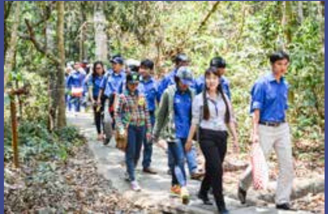
Đoàn cơ sở Sở Y tế tổ chức hành trình về nguồn thăm Trung ương cục miền Nam tại Tây Ninh.