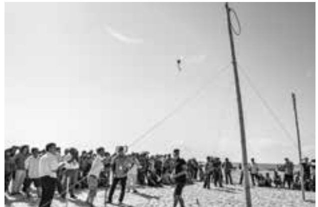
Thi ném còn.