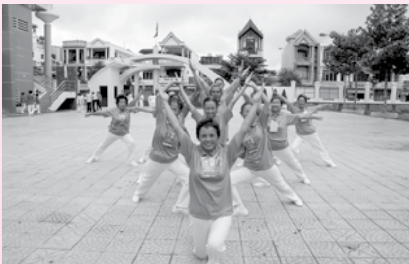
Dưỡng sinh giúp nâng cao thể chất và tinh thần, giúp người cao tuổi sống lâu, sống khoẻ.