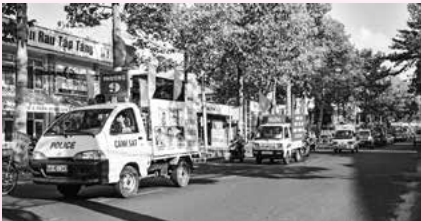
Xe hoa tuyên truyền phòng chống lao trên địa bàn thành phố Vũng Tàu.