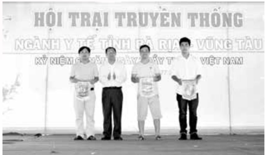
Bế mạc Hội trại và trao giải cho các đội đạt thành tích cao trong các môn thi đấu.

Nội dung thi ẩm thực: Giải Nhất thuộc về bệnh viện Lê Lợi; giải Nhì thuộc về bệnh viện Mắt; giải Ba thuộc về Chi cục ATVSTP và 8 giải khuyến khích thuộc về BV Bà Rịa, Công ty