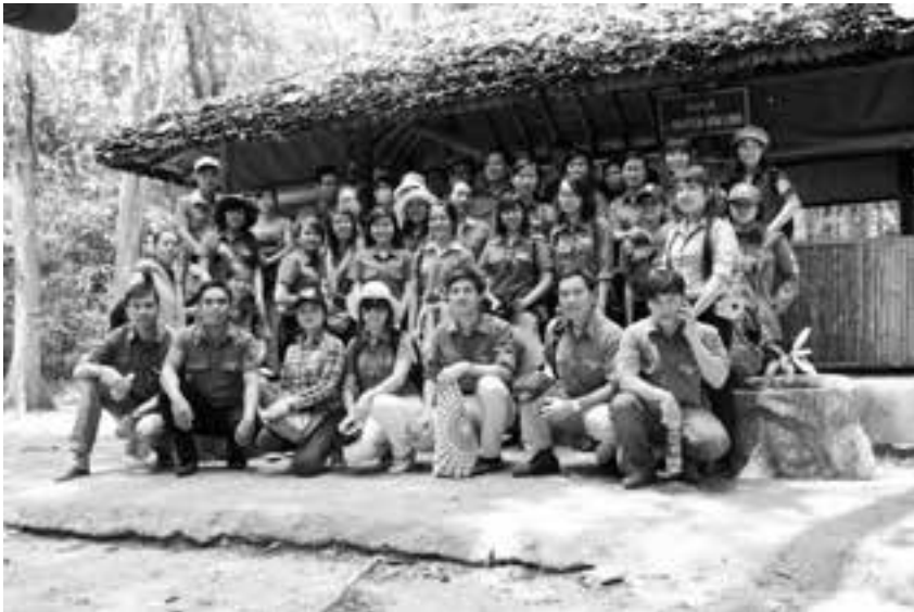
Chụp hình lưu niệm tại nhà lưu niệm đồng chí Nguyễn Văn Linh nằm trong quần thể khu di tích.

được lợp toàn bộ bằng lá Trung Quân (một loại lá đặc biệt không bắt lửa và không cháy lan) nhằm chống lửa của những đợt không kích bằng bom Napan, pháo kích của địch. Các ngôi nhà nằm trong Khu tổng hành dinh được nối với nhau bằng hệ thống giao thông hào dưới lòng đất. Gian bếp Hoàng Cầm nổi tiếng (một loại bếp dã chiến, có công dụng làm tan loãng khói bếp tỏa ra khi nấu ăn nhằm tránh bị máy bay phát hiện từ trên cao) đã thu hút sự chú ý, tìm hiểu của đông đảo các bạn đoàn viên, thanh niên trong suốt hành trình tham quan.