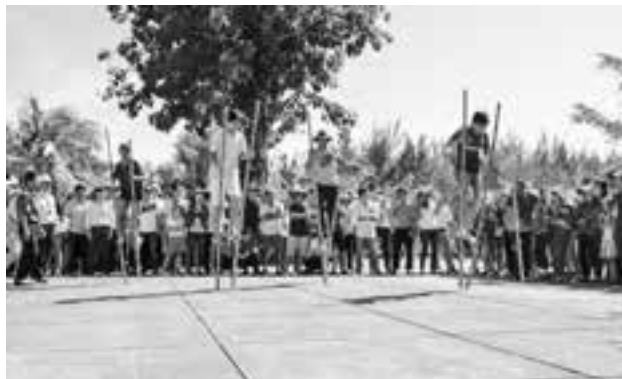
Thi đi cà kheo.