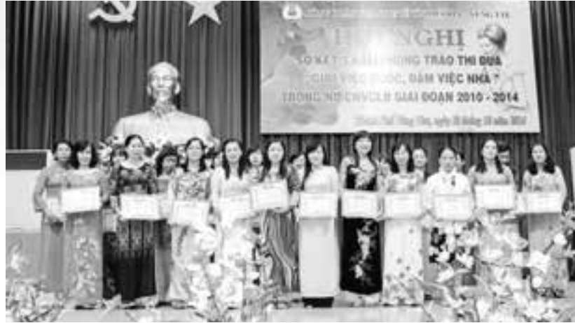
Công đoàn ngành Y tế tỉnh BR - VT trao tặng giấy khen cho "Phụ nữ 2 giỏi" trong Hội nghị sơ kết phong trào thi đua "Giỏi việc nước đảm việc nhà" giai đoạn 2010 - 2014.

Y tế là một ngành mang tính đặc thù. Ngành Y tế BR - VT tính đến nay có 3.745 CBCCVC-LĐ trong đó nữ là 2.510 chị (chiếm 67%), đặc biệt có 92 chị trình độ sau đại học, chuyên khoa I, thạc sĩ chuyên khoa II (3,6%); 495 đại học (9,7%); 1.625 trung cấp và 298 lao động khác. Vì vậy, lao động nữ có vai trò quan trọng trong mọi hoạt động của ngành Y tế.