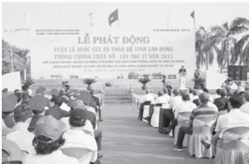
Vấn đề vệ sinh lao động – Phòng chống bệnh nghề nghiệp ngày càng được các cấp, ngành quan tâm. Trong ảnh: Lễ phát động Tuần lễ quốc gia ATVSLĐ – PCCN tại tỉnh BR – VT.

quan tâm đúng mức các yếu tố phát sinh trong quá trình sản xuất ảnh hưởng đến sức khỏe người lao động. Trong khi đó, lực lượng nhân sự đặc biệt là bác sĩ chuyên ngành sức khỏe nghề nghiệp còn mỏng, tuyến huyện hầu như không có. Công tác khảo sát môi trường lao động với các ngành sản xuất và công nghệ mới tại doanh nghiệp vừa và nhỏ hiện đang là một thách thức lớn. Việc chăm lo môi trường lao động ở các doanh nghiệp chỉ tập trung tại một số doanh nghiệp lớn, liên doanh với