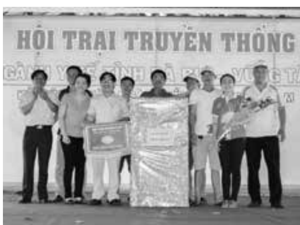
Tổng kết và trao giải hội trại.