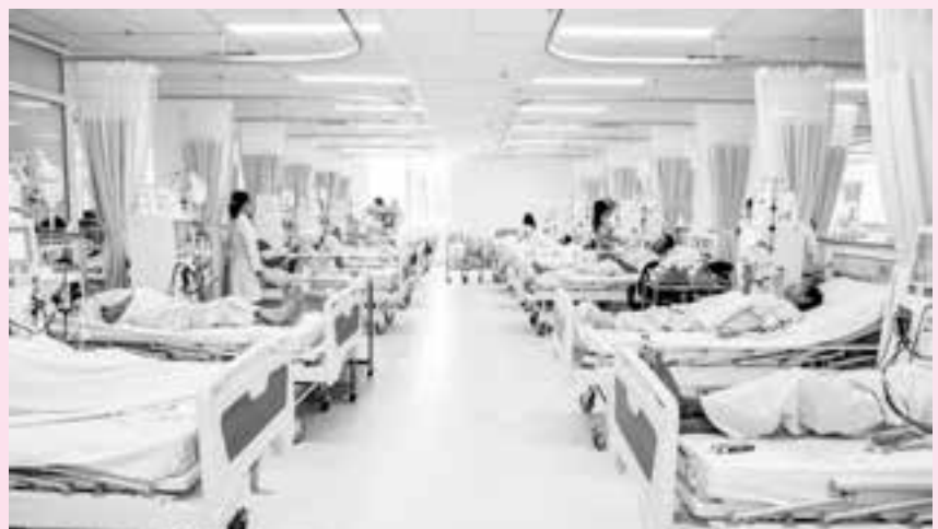
Khoa chạy thận nhân tạo, BV Bà Rịa.

Đầu tiên các tiêu chuẩn của ISO đưa ra là liên quan nhiều đến lĩnh vực thương mại và công nghiệp, nhưng các quốc gia trên thế giới, ngay cả Bộ y tế Việt Nam lại khuyến khích các đơn vị y tế phấn đấu quản lý bệnh viện theo ISO và ngay trong ngành y tế tỉnh Bà Rịa-Vũng Tàu trong quá khứ và hiện tại cũng có nhiều đơn vị được cấp chứng chỉ công nhận đạt chuẩn ISO trên một số lĩnh vực, như: