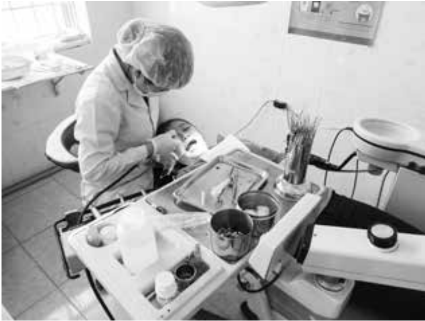
Phòng khám RHM Trung tâm Y tế huyện Tân Thành.

hài lòng cho người bệnh. Mặc dù chưa đạt yêu cầu đề ra nhưng công suất sử dụng giường bệnh đã được tăng lên đạt gần 70% (những năm trước chỉ đạt 50%).