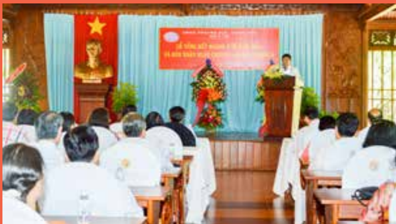
Quang cảnh Hội nghị.