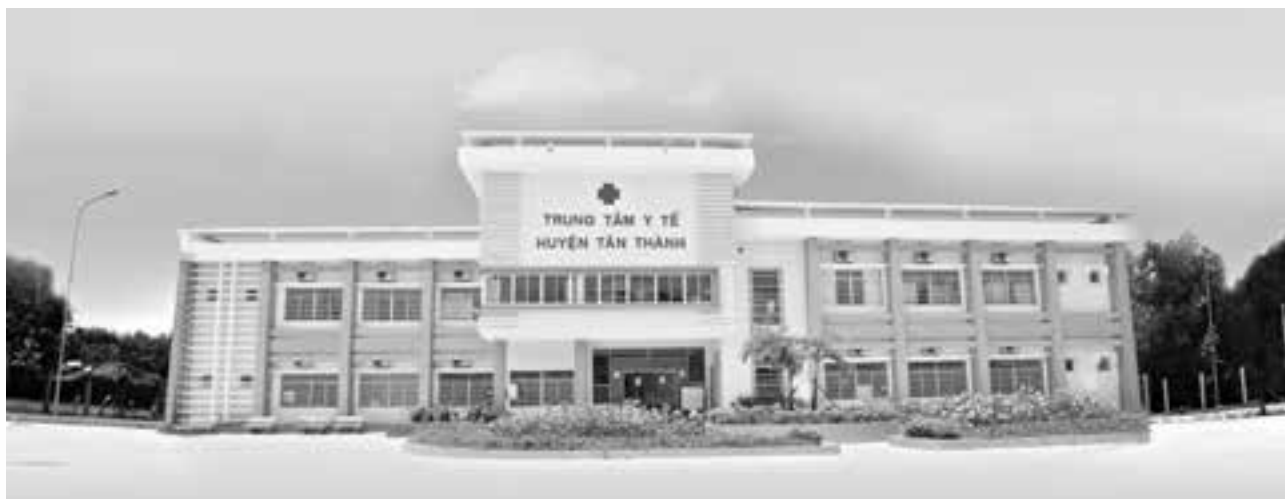
Trung tâm Y tế huyện Tân Thành.