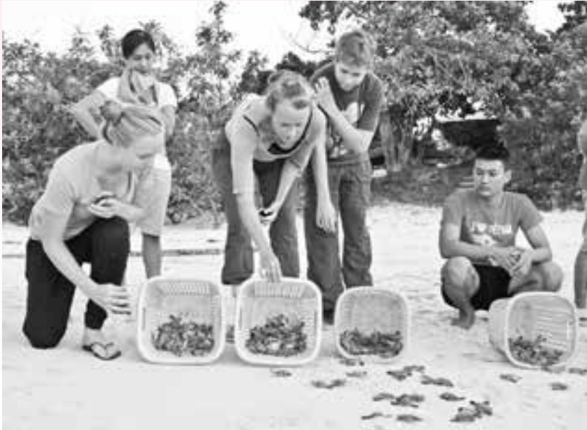
Khách du lịch nước ngoài tham gia hoạt động thả Rùa con về biển.

☞ các nhà quản lý vườn quốc gia Côn Đảo quản lý, khai thác hiệu quả, cũng như bảo vệ môi trường sinh thái khu vực Côn Đảo phát triển ổn định và bền vững. (2)