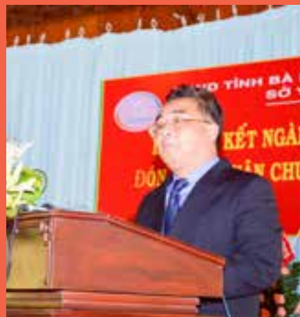
Ông Lê Thanh Dũng- Tỉnh Ủy viên, Phó chủ tịch UBND tỉnh phát biểu chỉ đạo tại Hội nghị.