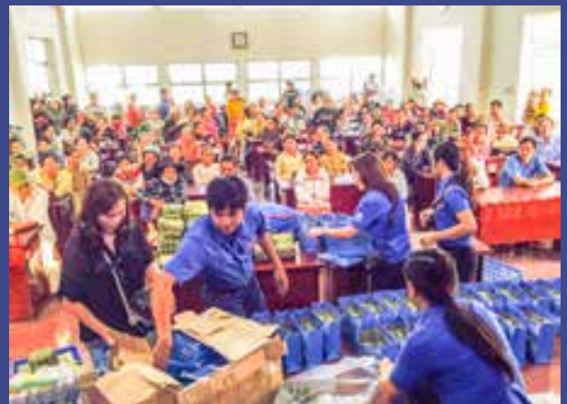
Chi đoàn Trung tâm TT- GDSK và Giám định Y khoa phối hợp với các Chi đoàn bạn, tổ chức Chương trình gói bánh chưng từ thiện tặng đồng bào nghèo xã Đá Bạc, huyện Châu Đức.