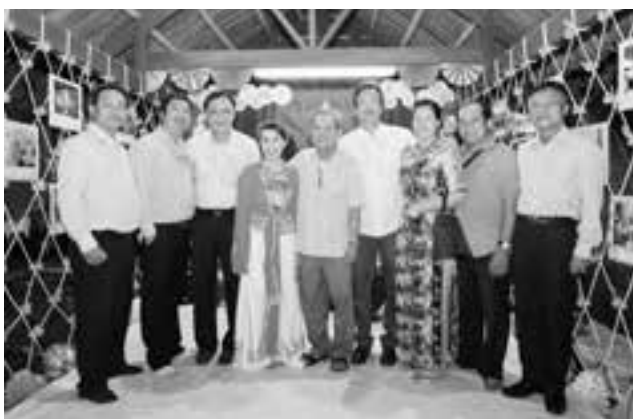
Các đại biểu thăm các tiểu trại và chụp hình lưu niệm.