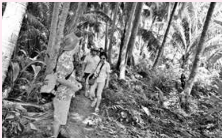
Hệ sinh thái rừng ngập mặn trên đảo Hòn Tre - vườn Quốc gia Côn Đảo.

Đề tài này đã được Hội đồng khoa học tỉnh tổ chức nghiệm thu và được các nhà khoa học chuyên ngành đánh giá cao. Đây là một báo cáo khoa học về điều tra cơ bản rất hoàn chỉnh, có giá trị cao trong thực tiễn. Những kết quả thu thập được là cơ sở khoa học để