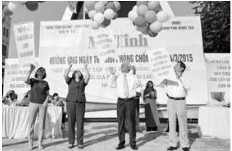
Lãnh đạo các Ban, ngành, đoàn thể cùng thả bóng bay trong lễ mít tinh, thể hiện quyết tâm chung tay đẩy lùi bệnh Lao.

» Sáng 24/3, tại quảng trường Trung Vương, Thành phố Vũng Tàu đã diễn ra lễ mít tinh hưởng ứng Ngày Thế giới phòng chống Lao. Dự lễ mít tinh có đại diện lãnh đạo các Sở, ban, ngành của tỉnh; Các đơn vị trong ngành Y tế tỉnh, lực lượng cán bộ, CNVC, đoàn viên, thanh niên, học sinh và nhân dân trên địa bàn Thành phố Vũng Tàu.