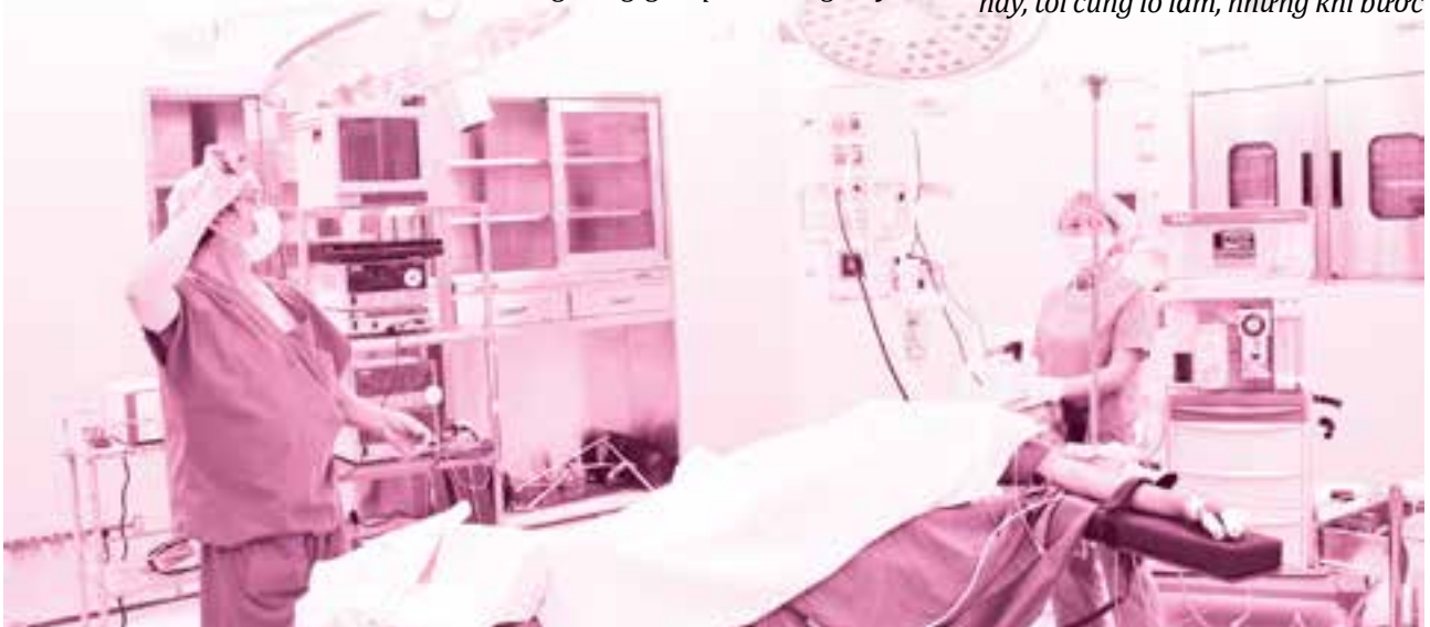
Phòng mổ bệnh viện Bà Rịa mới đầy đủ thiết bị hiện đại.