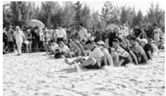
Thi đua thuyền trên cát.