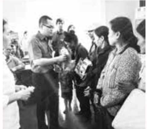
Tặng một phần quà gồm 1 cặp bánh chưng, 1kg đường và 1 chai nước mắm cho đồng bào nghèo ăn Tết.

Nhằm góp phần mang lại niềm vui trong dịp Tết cho người nghèo, đồng thời góp phần giáo dục truyền thống “lá lành đùm lá rách” cho đoàn viên thanh niên, ngày 13/2, Chi đoàn Trung tâm truyền thông giáo dục sức khỏe và Chi đoàn Trung tâm giám định y khoa tỉnh đã phối hợp với các Chi đoàn: Công ty Cổ phần dịch vụ lắp đặt, vận hành và bảo dưỡng công trình dầu khí biển (PTSC POS), Công ty Cổ phần dịch vụ tổng hợp dầu khí Vũng Tàu (PSV), Công ty Imperial Plaza tổ chức gói 500 chiếc bánh chưng, tặng đồng bào nghèo ở xã Đá Bạc, huyện Châu Đức.