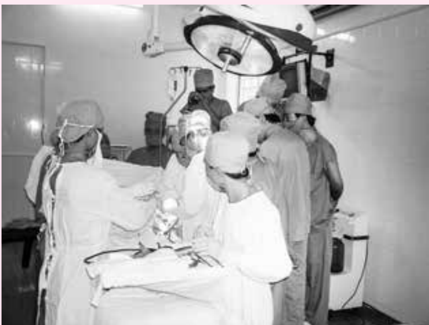
Phẫu thuật thay khớp háng tại BV Lê Lợi.

Trong thời đại hôm nay, với nền kinh tế của thế giới phát triển mạnh và rộng, Việt Nam cũng đã và đang phát triển, đang có những biến đổi sâu sắc trong một nền kinh tế thị trường định hướng Xã Hội Chủ Nghĩa mà chưa có mô hình tiền lệ trước đây. Một số nước đã áp dụng cho hệ thống y tế của nước mình những tiêu chuẩn quản lý như: JCI, (tại Mỹ), ANEAES (tại Pháp),