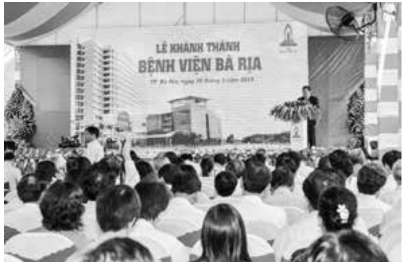
Quang cảnh của buổi lễ Khánh thành công trình bệnh viện Bà Rịa.

Công trình Bệnh viện Bà Rịa được khởi công vào ngày 19-8-2009, do Sở Xây dựng làm chủ đầu tư, tập đoàn Yooil Hàn Quốc thiết kế và tổng Công ty DIC Group thi công. Công trình có quy mô 700 giường, được xây dựng