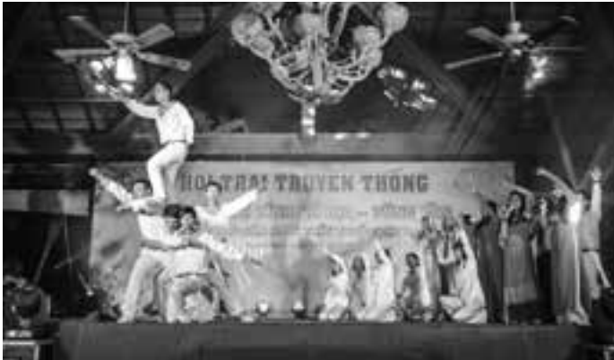
Thi văn nghệ.