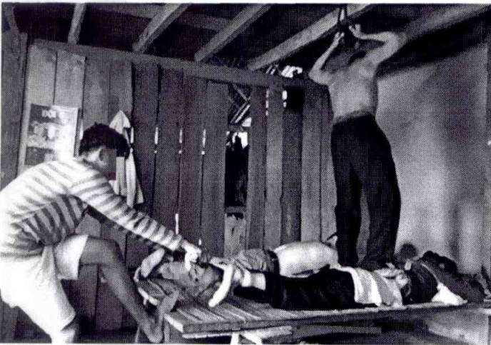
Đâm lưng, day, miết ở vùng cột sống người bệnh

Trên trần nhà, ông Xập làm một vòng dây để năm khi ông đứng trên lưng đệm, day, miết ở vùng cột sống người bệnh.