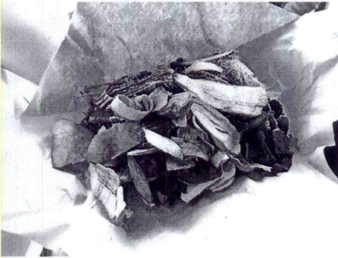
Một thang thuốc bác ông Xập bán cho bệnh nhân sau khi kéo giãn cột sống.

1 bệnh tình cậu của anh không đỡ nên chuyển hướng điều trị khác.