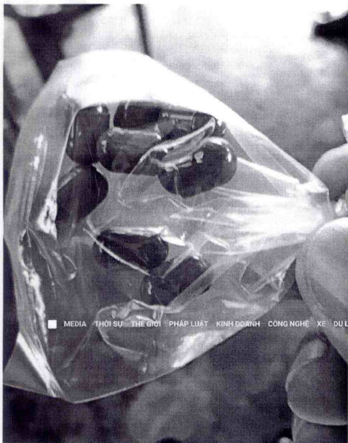
Thuốc viên con nhộng không tên ong. Xap ban cho bệnh nhân về nhà uống sau khi kéo giãn cột sống

■ MEDIA THỜI SỰ THẾ GIỚI PHÁP LUẬT KINH DOANH CÔNG NGHỆ XE DU LỊCH