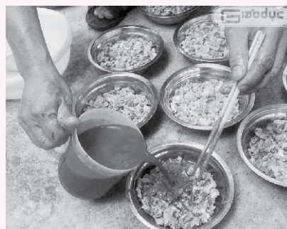
Không ăn tiết canh.

sử dụng thịt heo bệnh, chết làm thức ăn cho động vật khác và phải xử lý triệt để heo bệnh, chết (chôn, đốt đúng quy định của thú y); mang dụng cụ bảo vệ cá nhân cần thiết (găng tay,