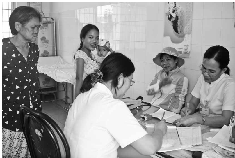
Khám chữa bệnh cho bệnh nhân tại Trạm Y tế Long Sơn, TP. Vũng Tàu.