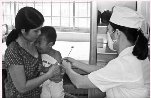
Chích ngừa cho trẻ em dưới 1 tuổi tại Trung tâm Y tế TP. Vũng Tàu.