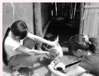
Không giết mổ và sử dụng gia cầm nghi bị bệnh cúm.

Tuy nhiên, hiện trên thế giới chưa ghi nhận sự lây truyền từ người sang người; chưa phát hiện ca bệnh hoặc ca nhiễm cúm