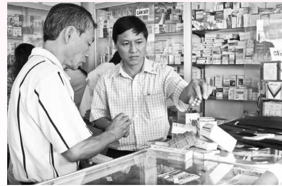
Đoàn kiểm tra hạn sử dụng thuốc tại các nhà thuốc trên địa bàn TP. Vũng Tàu.

Còn tại Hội nghị Tổng kết công tác năm 2012 – Phương hướng nhiệm vụ năm 2013 của Trung tâm Truyền