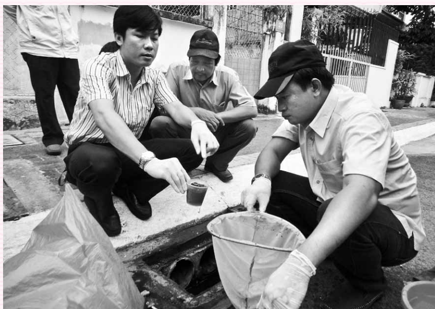
Trung tâm Y tế Dự phòng phối hợp với Viện Pasteur TP. HCM kiểm tra lãng quang các hố ga thoát nước tại TP. Vũng Tàu.

Năm là , phối hợp chặt chẽ với Sở Xây dựng trong quá trình xây dựng bệnh viện Bà Rịa và Lê Lợi. Đây