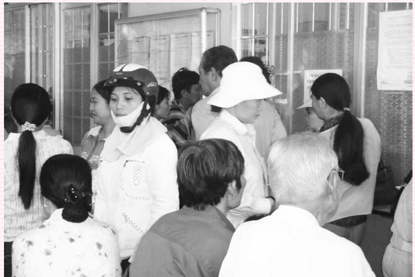
Bệnh nhân BHYT chờ lấy thuốc tại khoa Dược, bệnh viện Lê Lợi.

T ừ ngày 05/01/2013 – 01/02/2013, tất cả các đơn vị trực thuộc Sở Y tế đã tổ chức Hội nghị Tổng kết công tác năm 2012 – Phương hướng nhiệm vụ năm 2013,