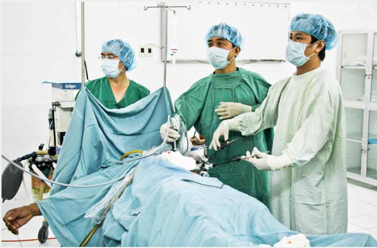
Phẫu thuật nội soi.