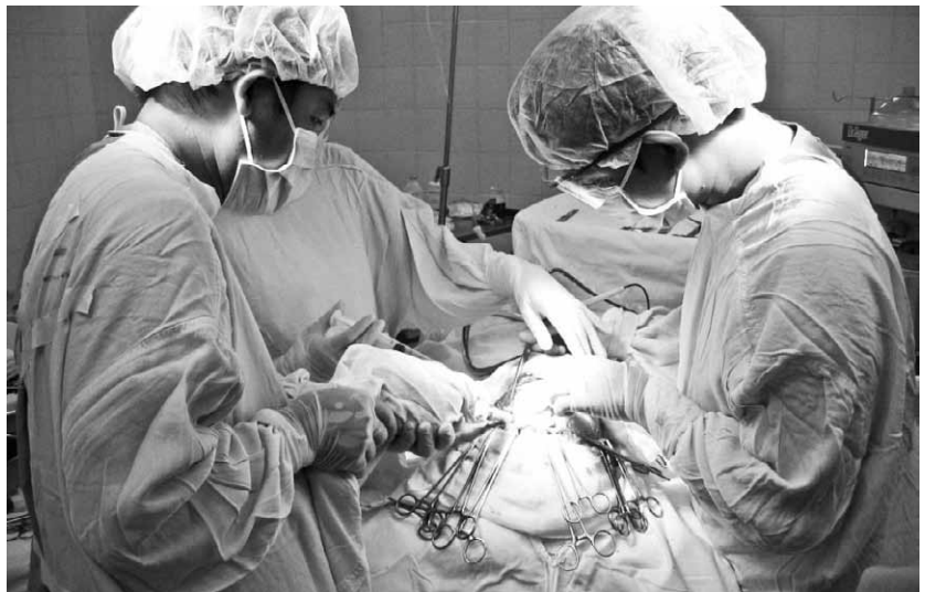
Một cas mổ sọ não tại bệnh viện Bà Rịa.

Ai cũng hiểu nghề bác sỹ là chữa bệnh cứu người, nhưng dường như ít người biết đến những nỗi vất vả, hy sinh thầm lặng, nhất là những ngày Tết. Trong khi nhà nhà đoàn tụ đón năm mới, người người đi du lịch đó đây, thì các y, bác hầu như không có Tết. Với họ, đó là lịch trực, là cấp cứu, là chăm sóc bệnh nhân.