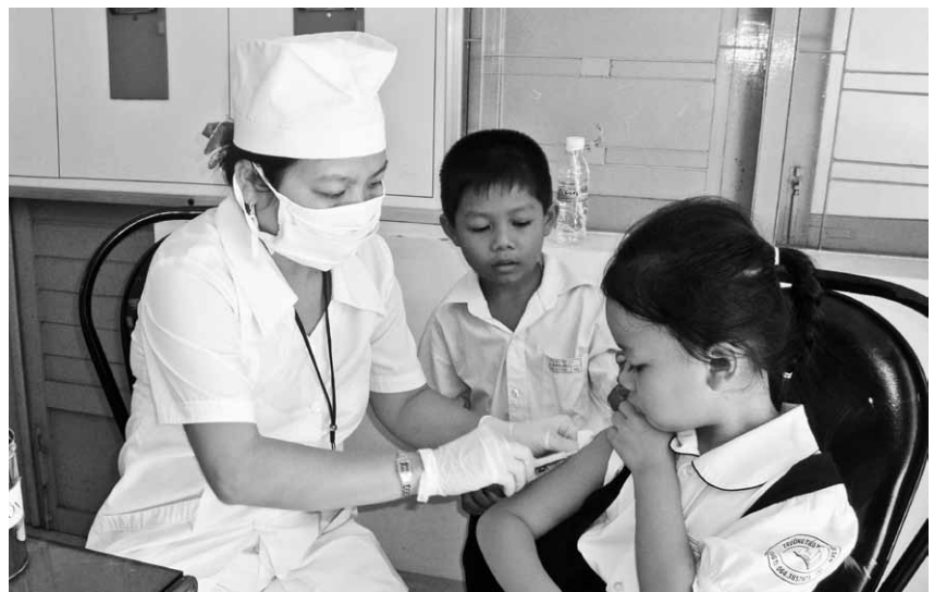
Tiêm vaccin cho trẻ tại Trạm Y tế phường 4, TP. Vũng Tàu.

Mặc dù phải thực hiện nhiều nhiệm vụ, nhiều chương trình trong năm 2012, song công tác tiêm chủng mở rộng (TCMR) của Trạm y tế (TYT) phường 4, Tp. Vũng Tàu vẫn duy trì bền vững những thành quả của mình, khẳng định sự thành công của một chương trình y tế Quốc gia có ảnh hưởng sâu rộng trong công tác bảo vệ sức khỏe trẻ em.