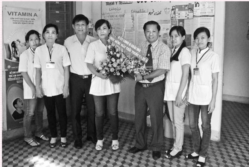
Trạm Y tế xã Bình Ba luôn nhận được sự quan tâm, chỉ đạo sâu sát của chính quyền địa phương.

Là đơn vị y tế cơ sở có nhiệm vụ chăm sóc sức khỏe ban đầu cho người dân địa phương thời gian qua, ngoài việc chú trọng thực hiện các chương trình mục tiêu y tế quốc gia, thực hiện công tác phòng bệnh cho nhân dân trên địa bàn, trạm y tế xã Bình Ba còn không ngừng nêu cao tinh thần thái độ phục vụ và học tập nâng cao trình độ chuyên môn nhằm thực hiện tốt công tác khám chữa bệnh, chiếm được tình cảm và sự tin yêu của người dân địa phương.