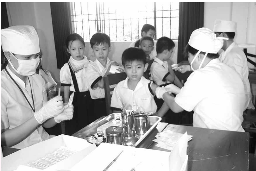
Tiêm chủng mở rộng cho học sinh tiểu học.