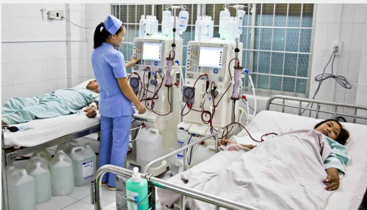
Cẩn thận kiểm tra từng thông số lọc máu.