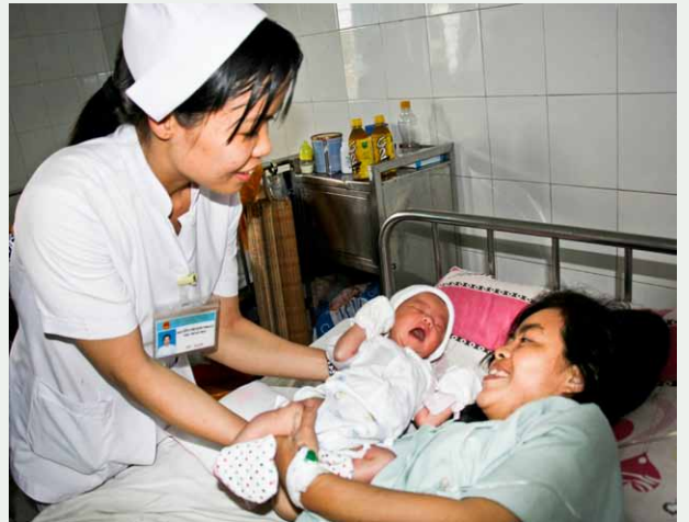
Hạnh phúc trao tay.