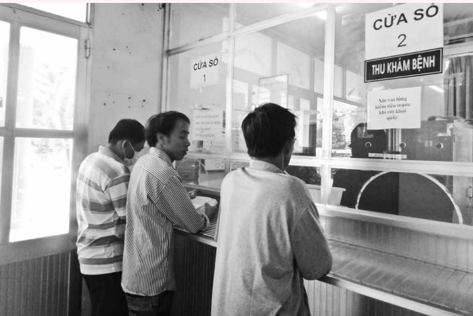
Cải cách thủ tục hành chính một biện pháp hiệu quả giúp giảm tải cho các cơ sở Y tế.

Y tế tỉnh Bà Rịa Vũng Tàu đã tổ chức triển khai thực hiện, xây dựng đề án và đã được các cấp có thẩm quyền phê duyệt. Nhưng vấn đề áp dụng cơ chế “Một cửa” vào giải quyết công việc hành chính tại Sở Y tế một cách đồng bộ, hiệu quả như thế nào? Cần có những giải pháp gì để cơ chế “Một cửa” thực sự là khâu đột phá, góp phần cải cách thủ tục hành chính và nhằm xây dựng một nền hành chính dân chủ, minh bạch, trong sạch, hiện đại, hoạt động có hiệu quả? Phân tích khoa học các yếu tố trên để đánh giá thực trạng và đưa ra các giải pháp khắc phục nhằm nâng cao chất lượng giải quyết thủ tục hành chính tại Sở Y tế trở thành điểm nhấn có tính chất