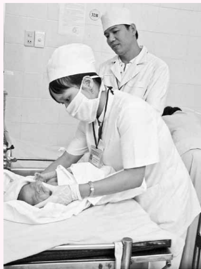
Chăm sóc trẻ sơ sinh tại bệnh viện Lê Lợi.

Ở thời điểm đó, một sự kiện như thế là hiếm, nhưng đã ảnh hưởng sâu sắc đến tâm lý làm việc của không chỉ bác sĩ N. mà cả đến chúng tôi, cả những em điều dưỡng, hộ lý. Ai cũng