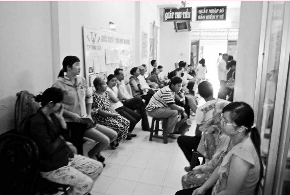
Áp lực đối với người thầy thuốc không chỉ là tình trạng bệnh nhân quá tải mà còn là tình trạng bạo hành ngày càng diễn ra thường xuyên tại các cơ sở Y tế.

không bị hành hung trong khi đang làm việc cứu người.