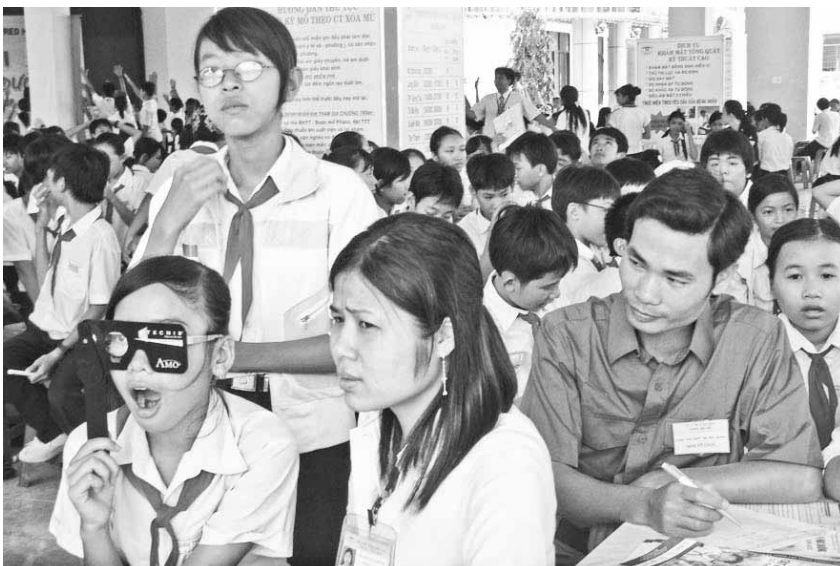
Trung tâm mắt tuyên truyền về chăm sóc mắt ban đầu, kiểm tra thị lực học sinh.