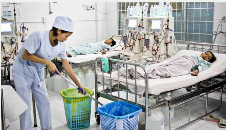
Vệ sinh sạch sẽ khoa, phòng.