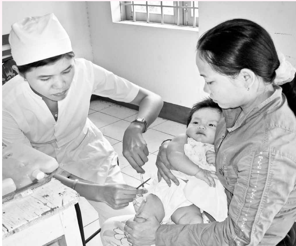
Chích ngừa cho trẻ tại trạm y tế.

Nghề Y được đào tạo rất bài bản, kéo dài tối thiểu 6 năm học, họ hiểu khá rõ về bệnh và diễn tiến bệnh, do đó khi gặp phải sai lầm nếu không chân thành nhận lỗi thì họ sẽ bước qua một ranh giới khác đó là nguy hiểm, mà nguy hiểm rất giỏi, người càng có kiến thức sâu rộng khi mắc phải lỗi này càng trầm trọng, khi nguy hiểm chỉ có tòa án lương tâm mới nói lên sự thật. Sự nguy hiểm lặp đi lặp lại nhiều lần sẽ trở thành một “ kỹ năng xấu ”. Vì vậy, khi gặp phải sai lầm người thầy thuốc hãy làm một quan tòa công tâm trong phiên tòa lương tâm, có như thế mới được xã hội tôn trọng và đồng nghiệp quý mến. Làm nghề nào cũng có cái sai, cho dù