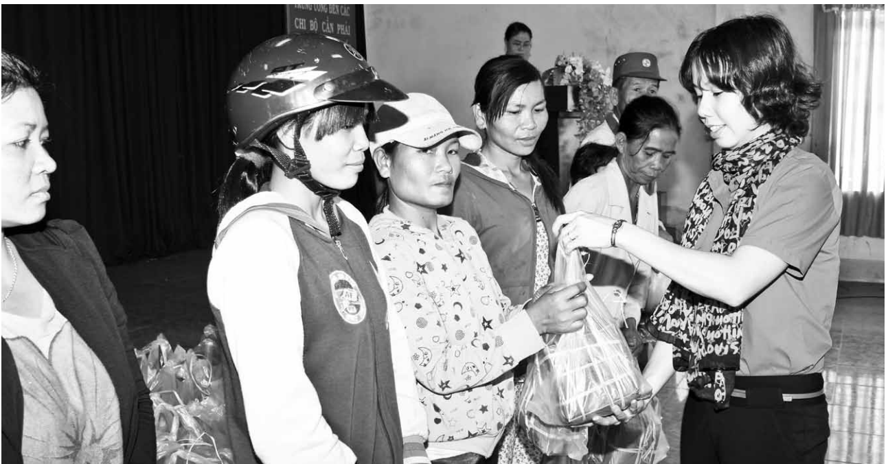
Tặng bánh chưng cho đồng bào dân tộc nghèo tại xã Tân Lâm huyện Xuyên Mộc.