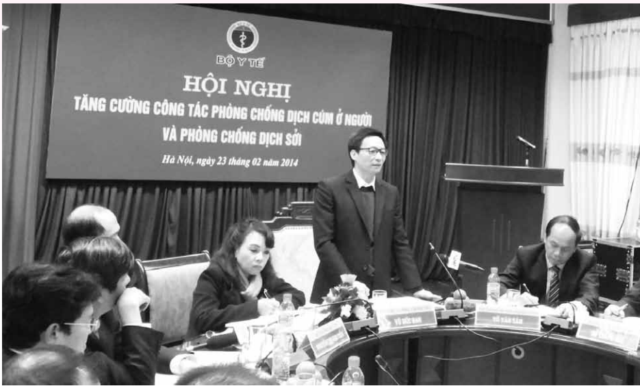
Phó Thủ tướng Vũ Đức Đam phát biểu chỉ đạo tại Hội nghị.