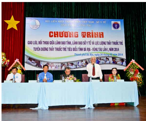
Các đồng chí lãnh đạo tỉnh và lãnh đạo ngành Y tế cùng giao lưu, đối thoại với các thầy thuốc trẻ.