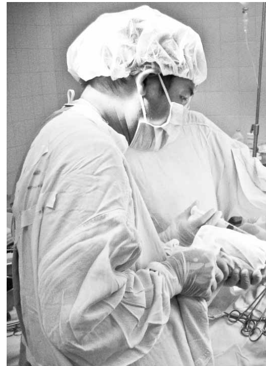
Một ca mổ sọ não tại bệnh viện Bà Rịa.

Mỗi độ Xuân về Tết đến, lại mang đến cho mọi người mọi nhà những niềm vui. Mọi người tấp nập, ngược xuôi, chuẩn bị những món ăn ngon nhất, vật dụng trang trí đẹp nhất để đón Tết. Thật là vui vẻ hạnh phúc và bình yên đến dường nào nếu như không có những vụ tai nạn giao thông (TNGT) bất ngờ xảy ra trên những tuyến đường. Nỗi bất hạnh ập đến vào bất kỳ thời khắc nào trong năm cũng đủ làm cho cả gia đình đau đớn, suy sụp, hướng hồ lại vào đúng dịp Tết đến Xuân về. Làm thế nào để giảm bớt những nỗi đau cho gia đình và người thân khi gia đình họ có nạn nhân bị TNGT nhập viện cấp cứu, để họ không rơi vào cảnh tang tóc, chia lìa vào đúng thời điểm nhà nhà sum họp, quây quần đón Tết thì trách nhiệm ấy lại thuộc về người thầy thuốc.