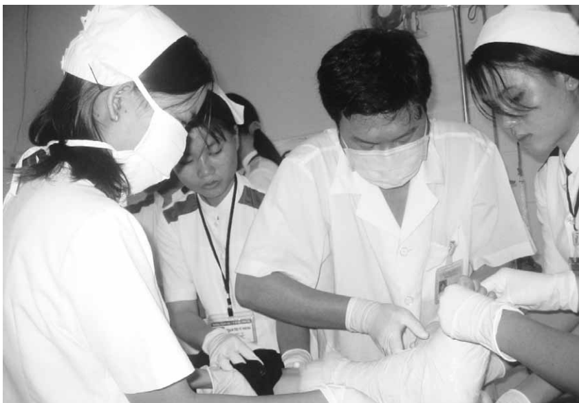
Một giờ thực hành của học viên Trường trung cấp Y tế tỉnh BR-VT.

“Muốn lúc nào cũng lãnh được hết trách nhiệm tinh thần của nghề chúng ta, chỉ có cách chắc chắn nhất, ấy là chuyên tâm vào nghề của mình, yêu nghề đó tha thiết và luôn luôn cố gắng để mỗi ngày một tiến. Người thầy thuốc muốn được tin nhiệm cần phải xứng đáng là người thầy thuốc, cần phải có một nếp sống giản dị, không xa hoa đàng điếm, phải lập gia đình và ở trong gia đình, nêu một tấm gương thanh bạch đứng đắn. Người thầy thuốc phải sống thực tiễn và sống theo thời đại. Trí tuệ phải được rèn luyện, trau dồi luôn, hợp nhân đạo. Đối tượng của sự học là con người, con người toàn diện. Người thầy thuốc không những nên tìm hiểu con người trên lãnh vực khoa học mà còn cần biết đến đời sống tâm linh nhờ được tiếp xúc với đủ mọi tầng lớp người, nhờ được trông thấy những thử thách của cuộc đời và làm quen với những kiệt tác của nhân tâm, của nghệ thuật và của khoa học. Sống cho người thân yêu và cho nghề của mình, đó không phải là một đề mục khá đẹp cho một mộ chí hay sao? Và nếu lại còn được cái đặc quyền sống cho Tổ Quốc nữa thì thật là sung sướng vô cùng. Và chung quy có lẽ đó là một cách thẳng thắn nhất để sống cho thầy thuốc gương mẫu đó.