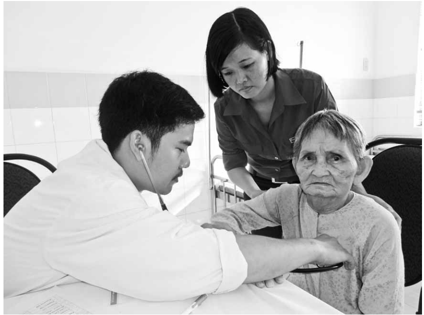
Khám bệnh, phát thuốc miễn phí cho người dân nghèo huyện Côn Đảo.