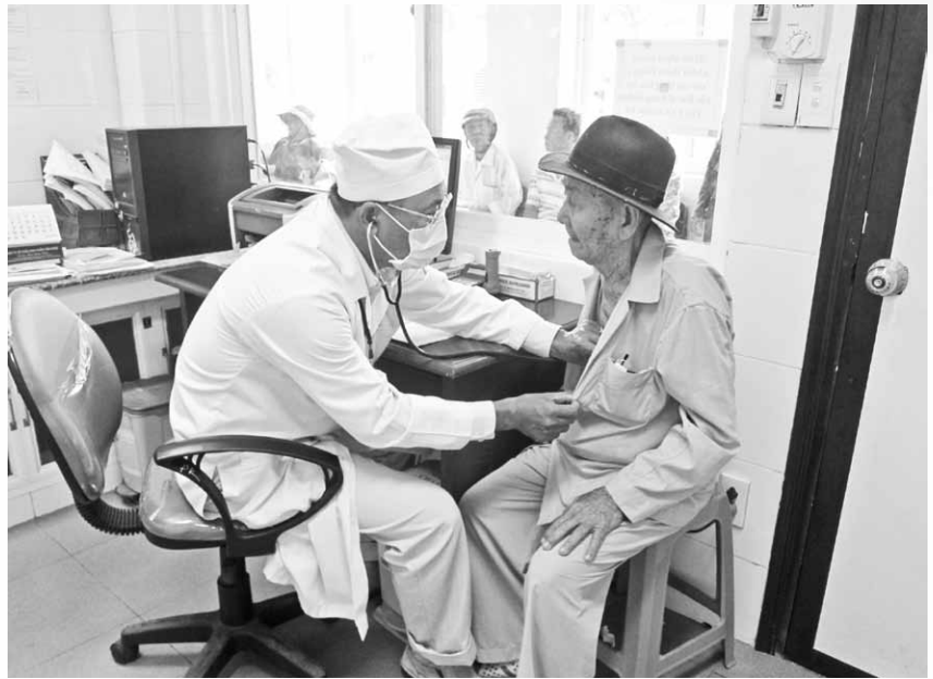
Thăm khám cho bệnh nhân tại TTYT huyện Đất Đỏ.

Cũng nhập viện trong tình trạng sức khỏe yếu do suy giảm chức năng thận, được các bác sĩ và nhân viên Y