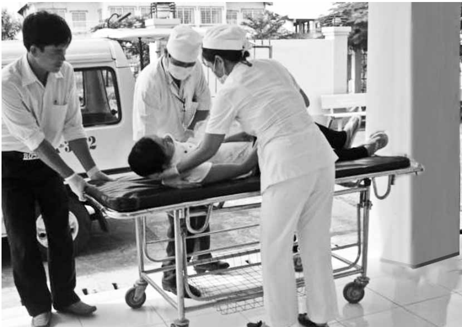
Khẩn trương khám, cấp cứu bệnh nhân.

Lãnh đạo Bv. Bà Rịa và Lê Lợi cho biết, trong những năm gần đây, số ca bệnh cấp cứu nặng thường có chiều hướng tăng lên nhiều hơn so với ngày thường. Điều đó đồng nghĩa với việc cấp cứu sẽ phải làm việc vất vả hơn, căng thẳng hơn. Những điều dưỡng, bác sĩ trực luôn phải chịu những áp lực rất lớn, trước hết là áp lực về chuyên môn. Bên cạnh đó còn là áp lực từ phía gia đình, người thân của bệnh nhân. Tuy nhiên, để giành lại sự sống cho người bị nạn, để đem sức khỏe cho mọi người, những người thầy thuốc đã hi sinh những khoảnh khắc đầm ấm đón Tết bên người thân. Đối với họ, được góp phần chia sẻ nỗi đau với người bệnh và đem đến một mùa xuân an lành cho mọi nhà luôn là niềm hạnh phúc lớn nhất.