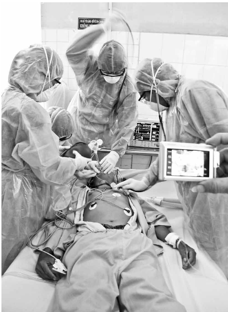
Diễn tập đối phó với dịch cúm A/H5N1 tại TTYT Long Điền.

Dịch cúm gia cầm hiện đã bùng phát mạnh ở hàng loạt địa phương trên phạm vi cả nước, trong đó tại một số địa phương dịch cúm gia cầm đã lây sang người dẫn đến tử vong. Riêng tại BR-VT, tuy chưa ghi nhận trường hợp nào mắc cúm gia cầm trên người, nhưng nguy cơ vẫn được cảnh báo và các biện pháp phòng, chống đang được ngành Y tế khẩn trương triển khai.