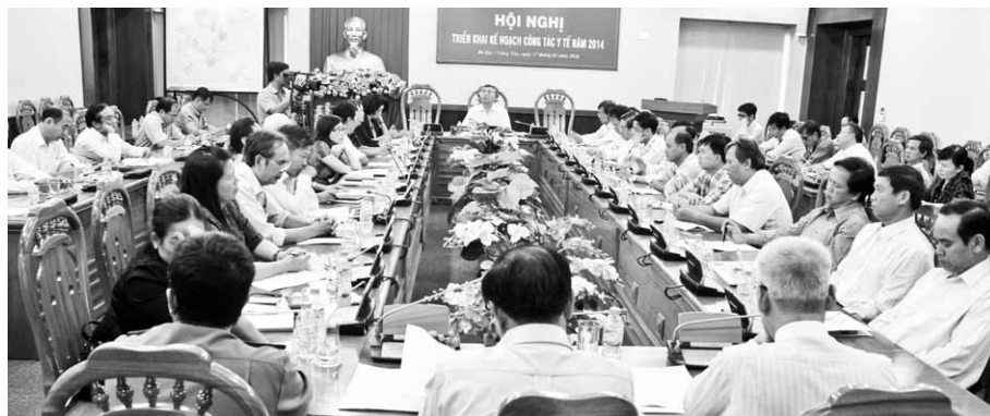
Hội nghị trực tuyến triển khai công tác Y tế năm 2014. (Ảnh chụp tại đầu cầu BR - VT).