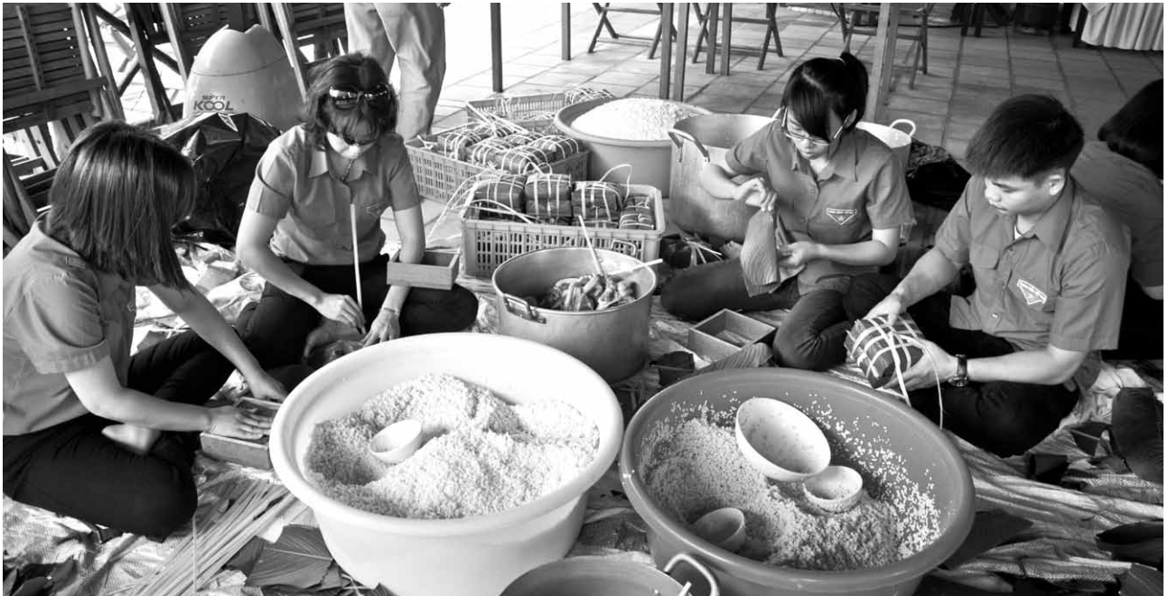
Các Đoàn viên tự tay gói bánh chưng.