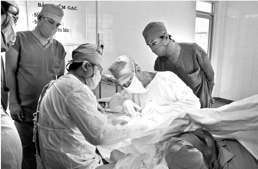
Bv. Chợ Rẫy TP. HCM chuyển giao kỹ thuật AVF cho các bác sĩ BV. Lê Lợi.