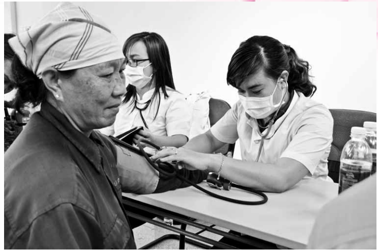
Hội Thầy thuốc trẻ tỉnh BR-VT khám, cấp thuốc miễn phí cho công nhân khu công nghiệp huyện Tân Thành trong dịp Tết Nguyên Đán.

Tối cùng ngày, tại Trung tâm Thương mại huyện Tân Thành, tỉnh Đoàn Bà Rịa – Vũng Tàu và Hội Liên hiệp Thanh niên Việt Nam tỉnh đã tổ chức buổi ra mắt Ban Vận Động Hội Thầy thuốc trẻ tỉnh BR-VT gồm 18 thành viên.