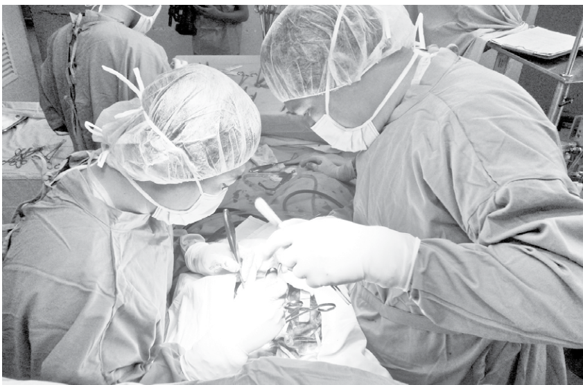
Một ca phẫu thuật tim tại bệnh viện Nhân Dân 115 TP. Hồ Chí Minh.