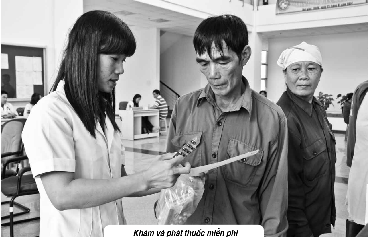
Khám và phát thuốc miễn phí cho công nhân khu công nghiệp tại huyện Tân Thành